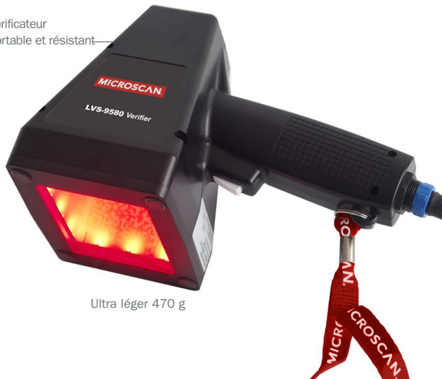
Ultra léger 470 g