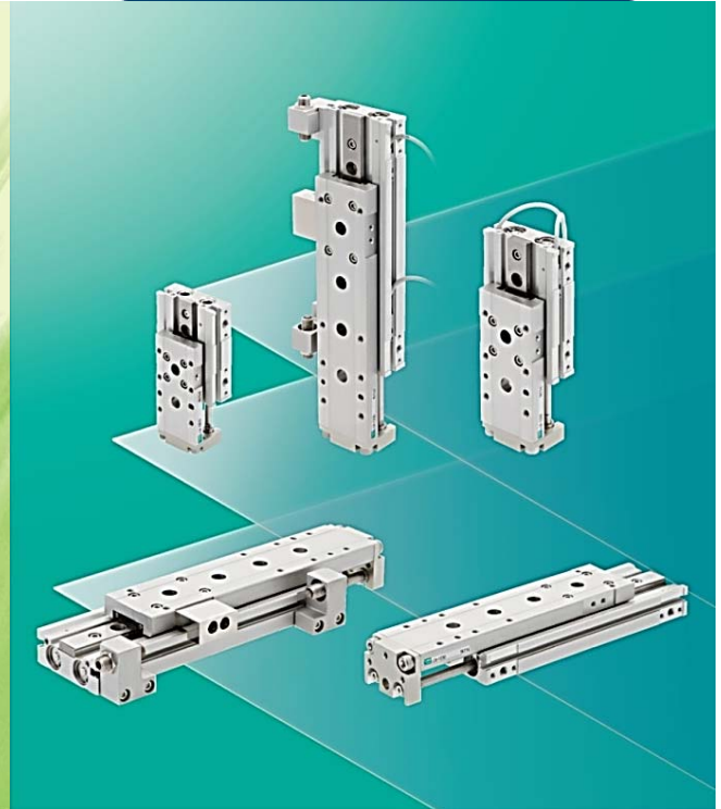
Série LCR Légère & Rigide