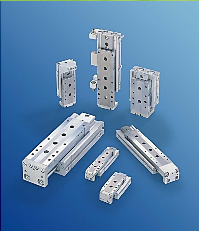
Série LCG Précise & Rigide