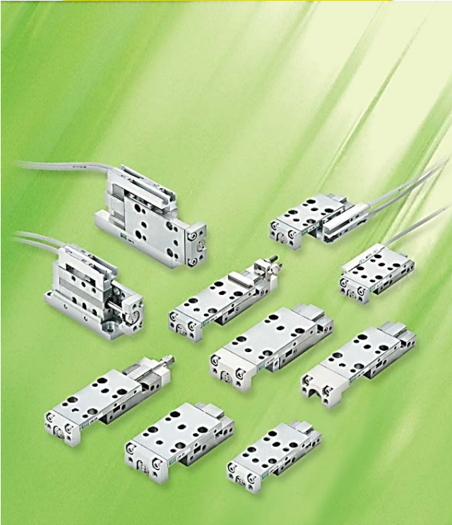
Série LCM Compacte & Précise